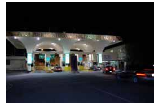
Cd. Juárez Chihuahua

CASI 100,000 PESONAS YA HAN VIVIDO EL TOUR DE LA VIDA DE SANOFI AVENTIS