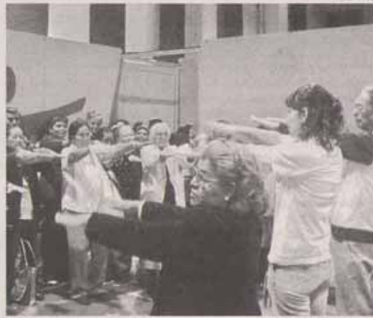
La interacción será la mejor manera de aprender a llevar una alimentación saludable que nos ayude a prevenir enfermedades cardiovasculares.

Esta campaña es un museo interactivo que tiene como objetivo orientar y sensibilizar a las personas a través de divertidos talleres, para que modifique sus malos hábitos alimenticios y prevenga enferme-