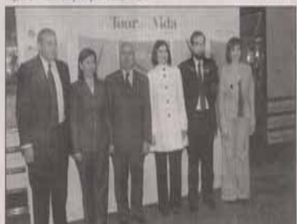
Autoridades estatales y municipales encabezaron el inicio de 'El tour de la vida'