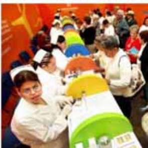
El museo Basurero de la salud El Tour de la Vida ofrece diagnósticos gratis de niveles de glucosa y colesterol.

La muestra al museo es gratuita, pero para salir de él se necesita que