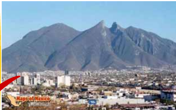
Monterrey Nuevo León