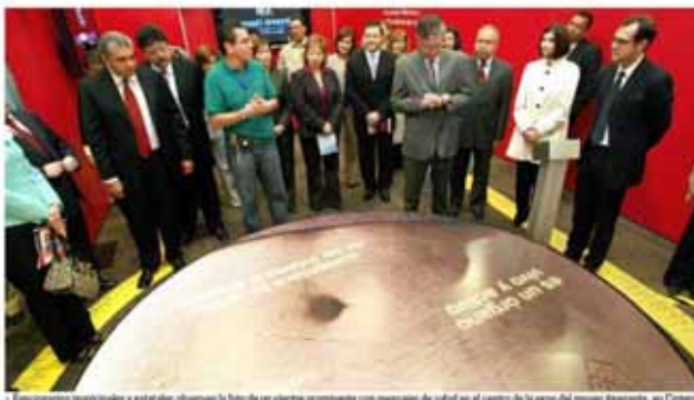
Funcionarios municipales y estatales observan la foto de un video preventivo con mensajes de salud en el centro de la expo del museo Basurero, en Coahuila.

Inician expo contra la diabetes y la hipertensión