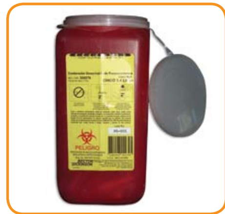
Recipiente para residuos punzocortantes