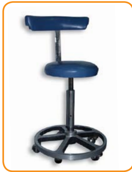
Banquillo del asistente