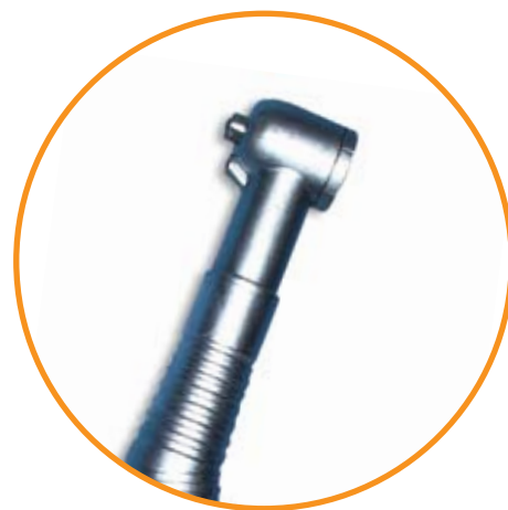
Pieza de mano de alta velocidad autoclavable

La pieza de mano de alta velocidad puede contaminarse con fluidos bucales del paciente potencialmente infecciosos, de sangre, saliva y exudado purulento, entre otros. Es posible que este material retenido sea expulsado intra-bucalmente, durante usos subsecuentes, es por esto que las piezas de mano deben ser esterilizadas entre paciente y paciente, con calor húmedo, siguiendo los procedimientos de limpieza y mantenimiento descritos por el fabricante para garantizar su esterilidad y funcionamiento.