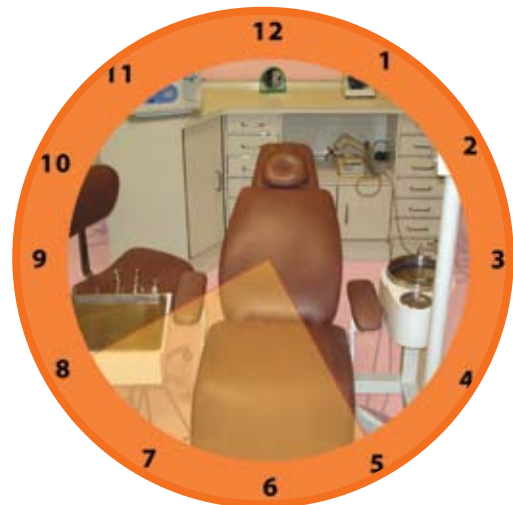
Círculo de trabajo zona de transferencia