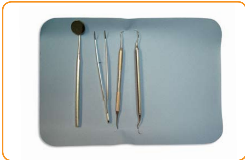
Campo operatorio desechable

Es el sitio donde se coloca el instrumental y los materiales a utilizar; es una barrera de protección para los pacientes, debe ser desechable y no reutilizado con el mismo o con otro paciente.