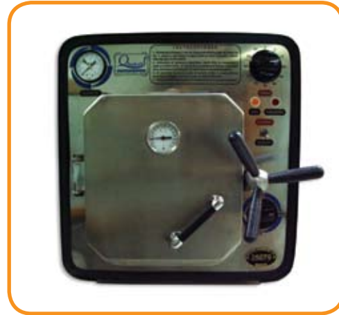
Esterilización por calor húmedo-Autoclave

El autoclave es un equipo de esterilización por vapor saturado, utilizando para tal fin agua desmineralizada. La esterilización se logra por medio de la presión del vapor de agua a temperatura elevada.