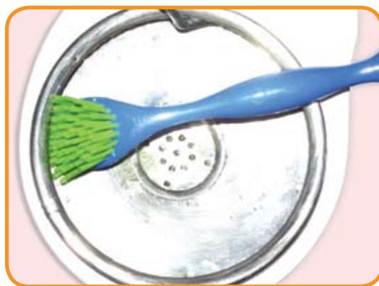
Limpieza de la escupidera