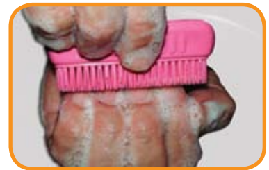
fig.2 Iniciar el cepillado a partir de las uñas