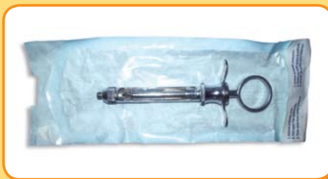
Empaquetado del instrumental

El empaquetado del instrumental debe realizarse en bolsas específicas para este fin o con papel kraft, evitando utilizar papel poroso.