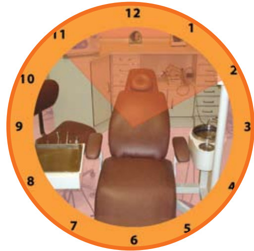
Círculo de trabajo zona estética