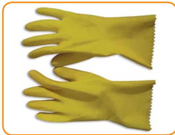
Guantes de hule grueso para descontaminación de áreas