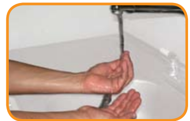
fig.5 Enjuagar cada brazo por separado