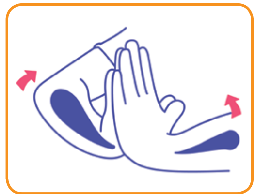
Ejercicio de relajación* Entrelazar las manos y apretarlas