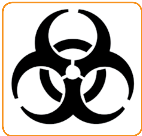
Símbolo Internacional de "Riesgo Biológico"

Para el desecho de estos contenedores se recomienda realizar convenios con hospitales, clínicas o con empresas recolectoras de desechos biológico infecciosos.