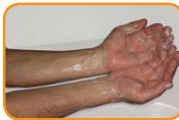
fig.4 Seguir desde la punta de los dedos hasta los codos