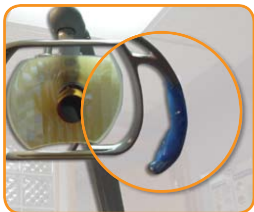
Aislado de manija de la lámpara dental con plástico

- http://www.osap.org/worldwide/spanish/resources/ic/osapguidelines.htm ; accesado el 26 de agosto de 2006.