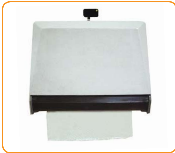
Toallas desechables para secado de manos

El secado se realiza con una toalla de papel para cada mano, debe comenzar en los dedos, para luego dirigirlo a la palma y dorso de las manos, y finalmente a la superficie de los brazos.