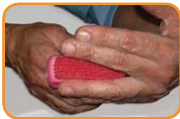
fig.3 Cepillar cada dedo e interdigitalmente