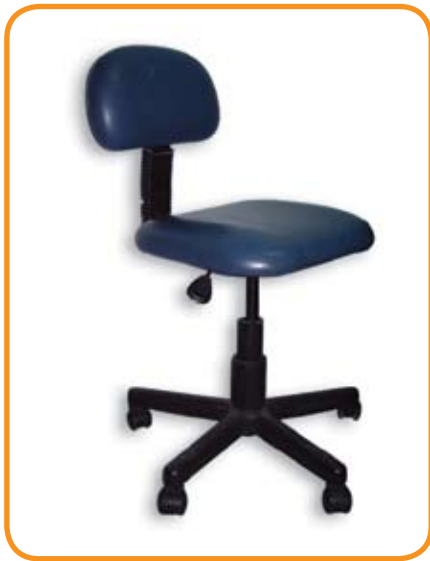
Silla de operador

El material de recubrimiento del mobiliario antes mencionado debe ser de vinilo, liso sin costuras, lavable y resistente a soluciones desinfectantes de nivel intermedio.