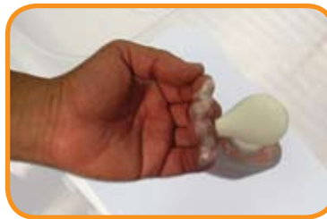
fig.1 Aplicar el jabón