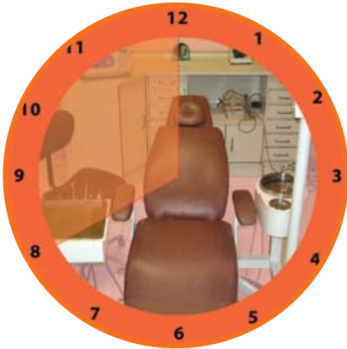
Círculo de trabajo zona del operador