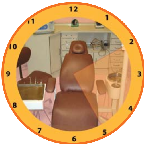
Círculo de trabajo zona del asistente dental