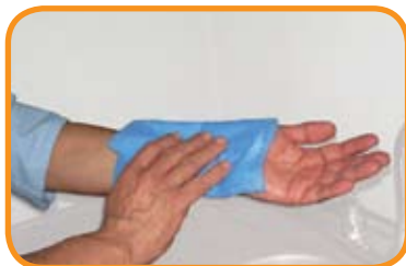
fig.6 Secar con toalla estéril