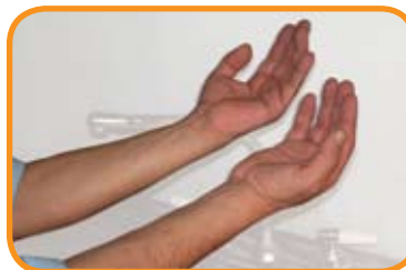
fig.7 Mantener las manos hacia arriba y no tocar nada hasta ponerse los guantes