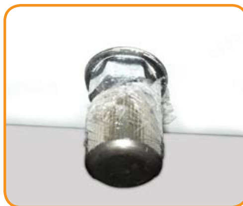
Aislado de controles de la unidad dental con plástico